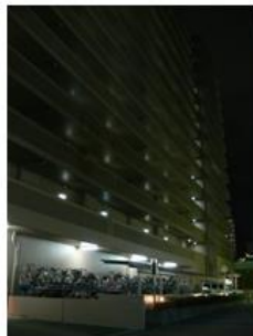
マンション外部の明かり 個別玄関前と駐輪場の明かり が見えている