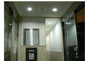
1/2消灯 メイルボックス(昼夜点灯)