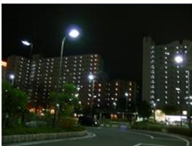
立ち並ぶマンション群の夜景(栗東)