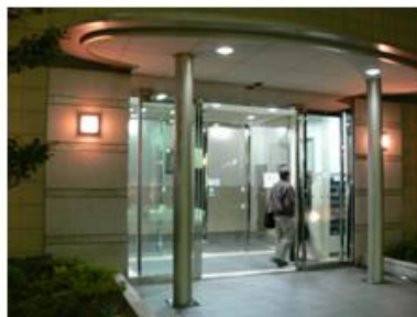
マンションAの玄関