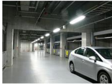
屋内駐車場(安全のためか非常に明るい)1/2で充分かも